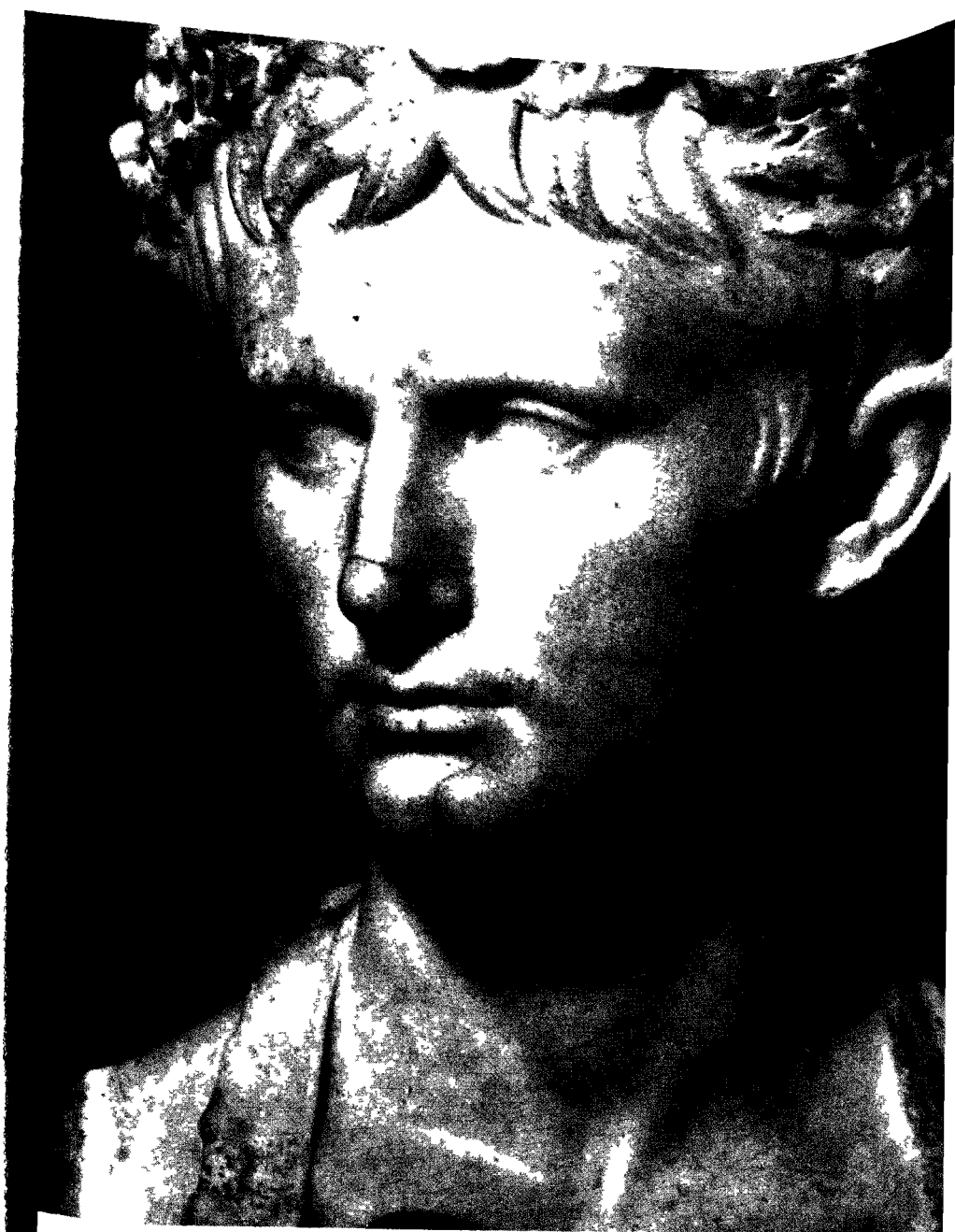
El emperador Augusto, 27 a C -14 d.C